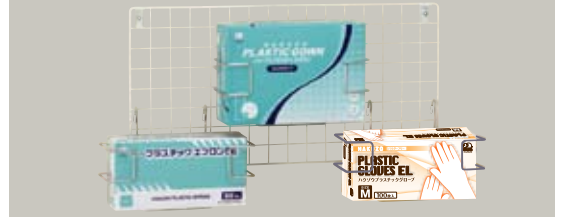
壁掛け用ホルダー(横向き)