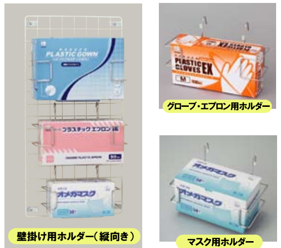
グローブ・エプロン用ホルダー