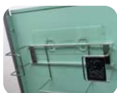
リシールフックが装着できます。