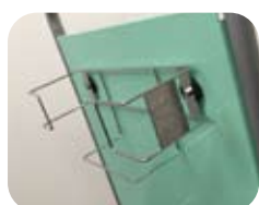
マグネットが装着できます。