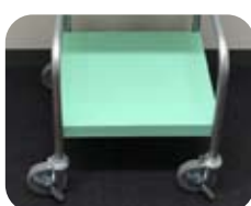
ロック機能により、固定が可能です。