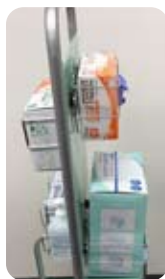
ホルダーを 両面に装着できます。