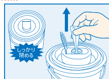
④内蓋をしっかりと閉め、開口部からクロスを取り使用します。