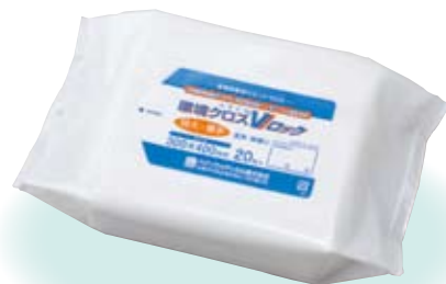
特大・厚手タイプ(20枚入) (400mm×300mm)