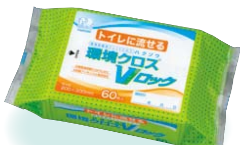
トイレに流せるタイプ(60枚入) (200mm×300mm)