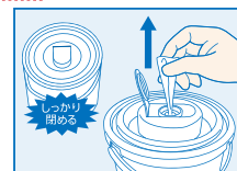
④内蓋をしっかりと閉め、開口部からクロスを取り使用します。