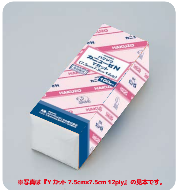
※写真は『Yカット 7.5cm×7.5cm 12ply』の見本です。