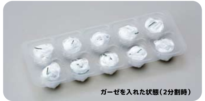
ガーゼを入れた状態(2分割時)