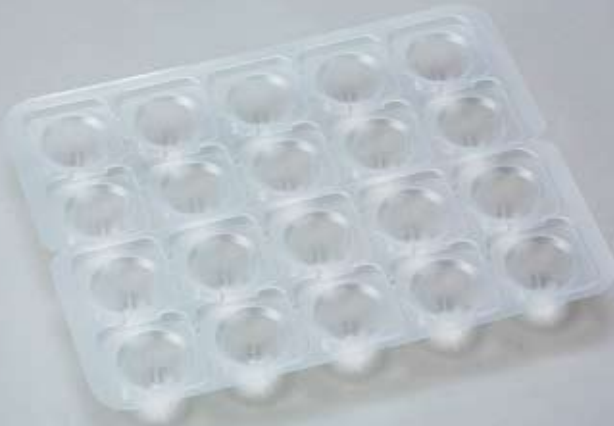
通常時(製品重量:約20g)