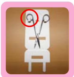
シートをセットし、赤枠のようにリングに台紙を入れ込みます。