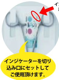
インジケータ差し込み口