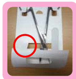
折り込んだ後、赤枠の先端を穴に入れていきます。