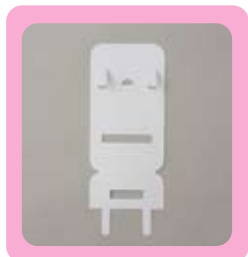
シートを準備します。