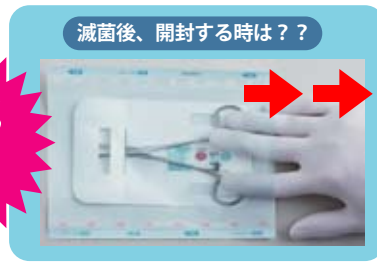
滅菌後、開封する時は??