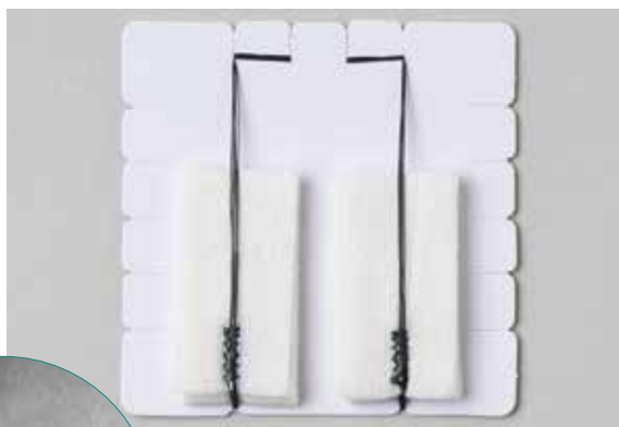
台紙に左右5枚ずつ重ねて、巻き付けて固定。