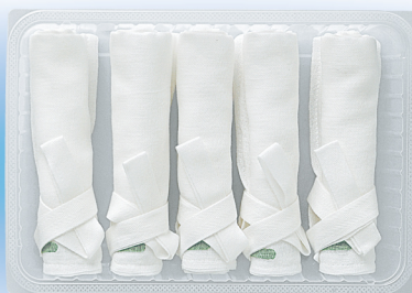
トレー入りタイプ(ロールタイプ)