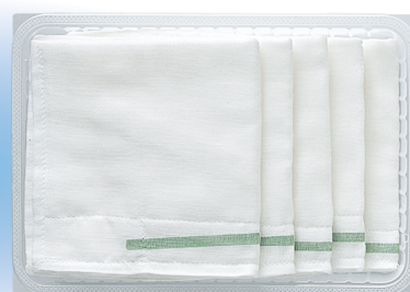
トレー入りタイプ