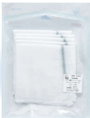
滅菌バッグ入りタイプ