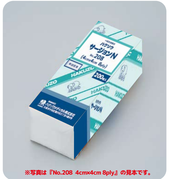
※写真は『No.208 4cmx4cm 8ply』の見本です。