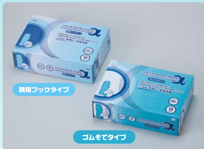
親指フックタイプ