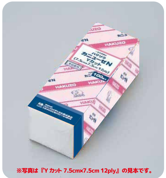
※写真は『Yカット 7.5cm×7.5cm 12ply』の見本です。