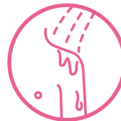
濡れた肌の拭き取り