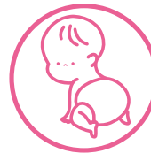
ベビーのおむつ替えシート