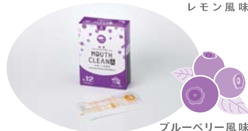
ブルーベリー風味