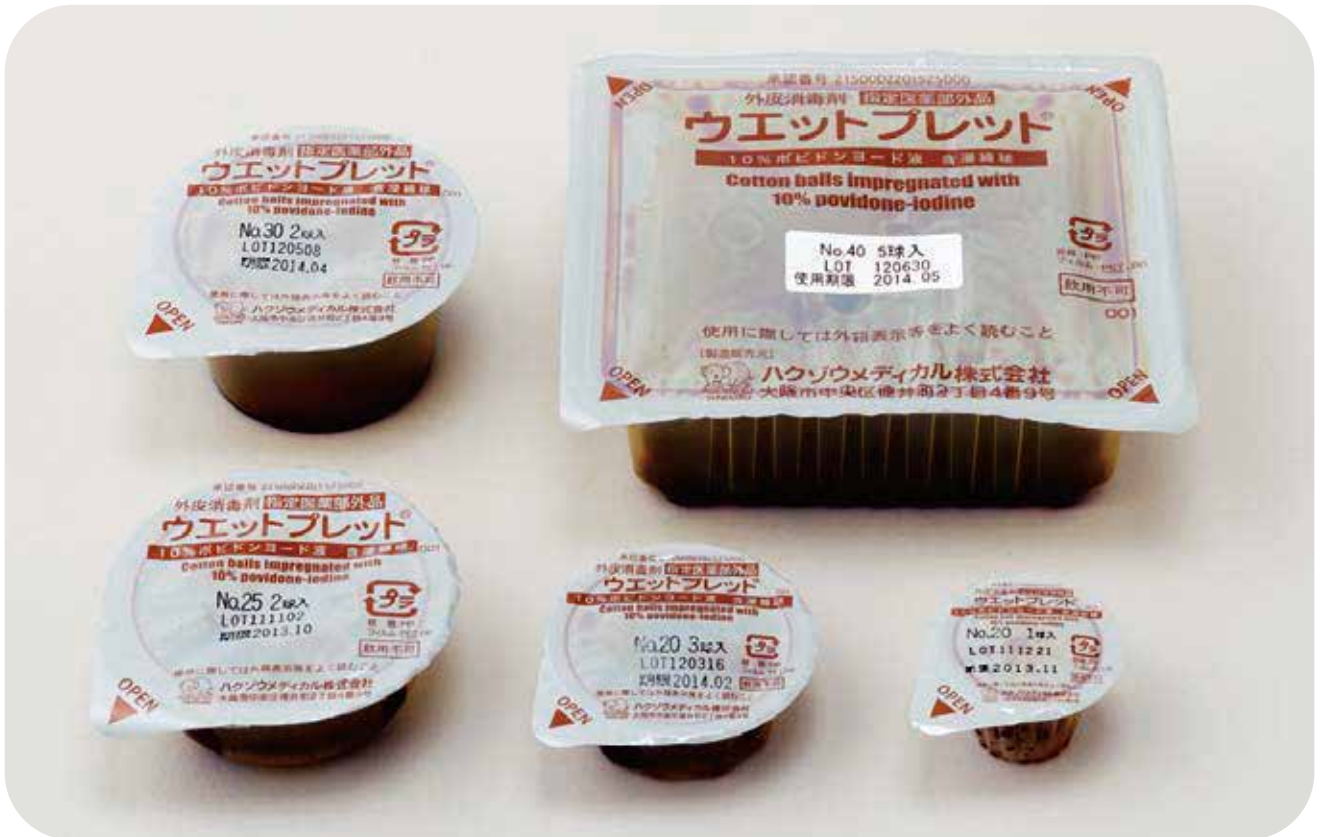
【10%ポビドンヨード液量一覧】