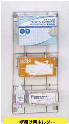
壁掛け用ホルダー