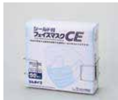
シールド付きフェイスマスク