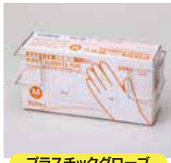
プラスチックグローブ