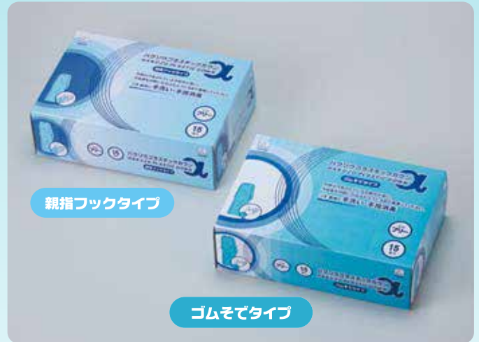
親指フックタイプ